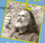
Jan Dau MELHAU

C'est en fredonnant que Lucie flirte avec l'obscurité et ses esprits. C'est en cheminant qu'elle nous livre trois instants sensibles, trois morceaux de vie. Trois personnages avancent à l'aveuglette dans la vie et s'enfuient dans la nuit... Mais finalement ces trois personnages ne sont peut-être qu'un seul homme... La conteuse déroule sous nos yeux une vie d'homme, une vie riche et tourmentée.